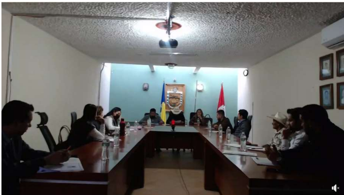
DECIMA SEPTIMA SESIÓN ORDINARIA