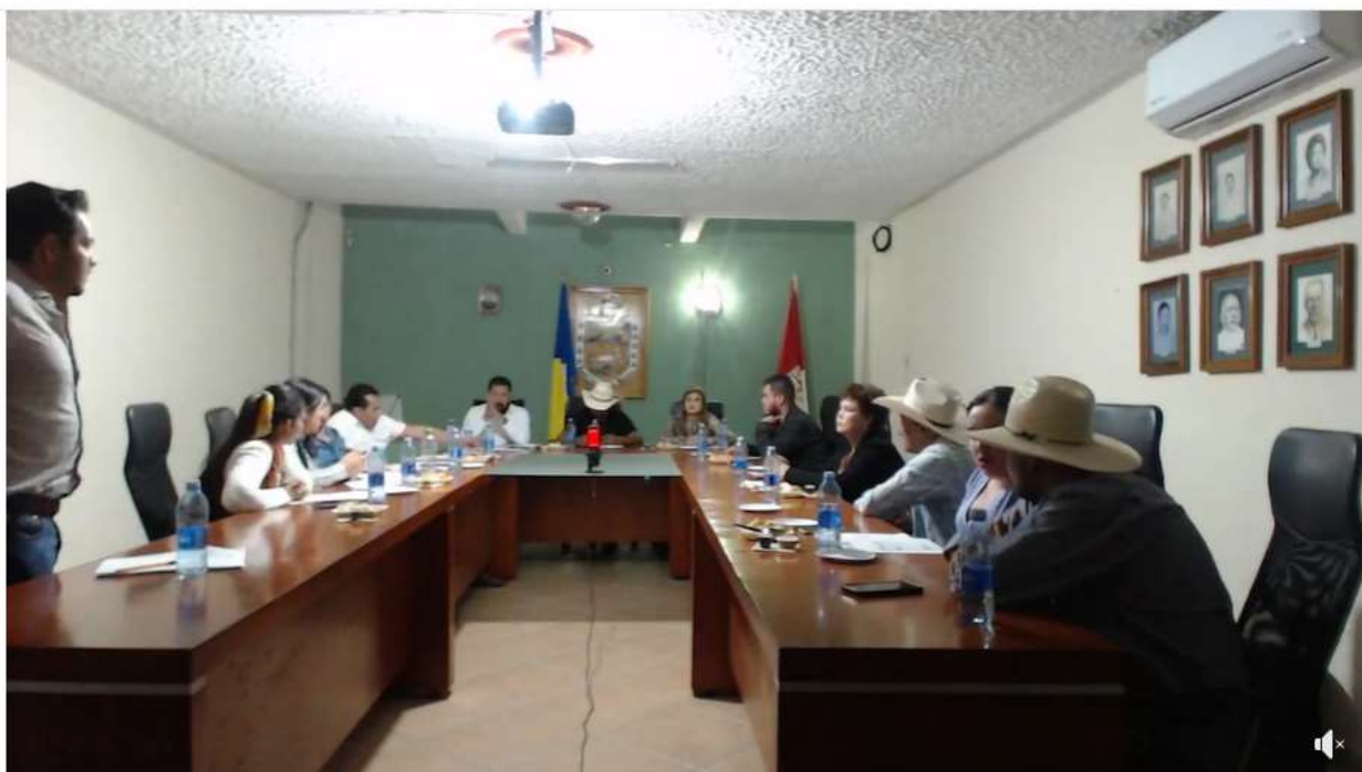
DECIMA SEXTA SESIÓN ORDINARIA