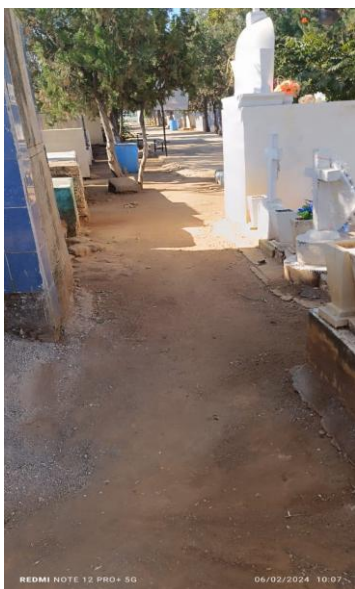
AREA RECÍÉN ASEADA EN EL PANTEÓN