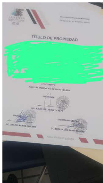
ENTREGA DE TITULO DE VENTA DE TERRENO